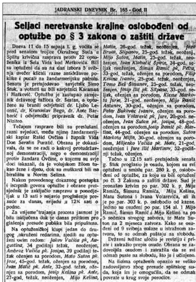
Jadranski dnevnik br. 165/1935 o suđenju stanovnicima Vida

rima“) koji su bili osnovni element velikosrpske represije u toj državi.