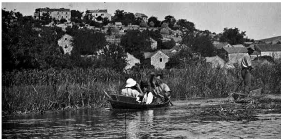
Prizor iz poratnog Vida, selo u pozadini

U takvim je okolnostima stasala skupina mladića, u velikoj većini malodobnika, koji su se udružili u tajnu političko-revolucionarnu organizaciju koju su nazvali Hrvatski omladinski pokret odnosno Hr-