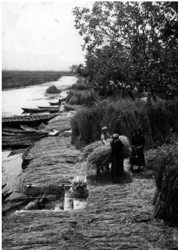
Rječica Norin protječe kroz Vid

Svaki član skupine je polagao prisegu sljedećeg sadržaja: „Zaklinjem se hrvat- skom čašću da ću poštovati i izvršavati pošteno zakone naše novo osnovane or- ganizacije. Zaklinjem se da neću istupiti iz organizacije i da neću otkriti njezino postojanje, da neću ni pod koju cijenu iz-