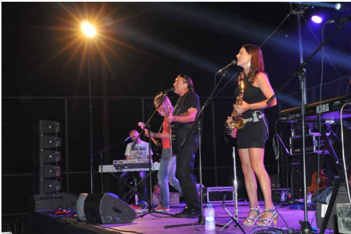
Koncert „Zabranjenog pušenja“ za pok. Stipu Čambera

To ljeto započelo je tužno. Najtužnije ikad. Jedan običan ljetni dan se pretvorio u crnu zimu. Muk i izgubljeni pogledi. Stipe je otišao. Ovaj put na jedno dugo putovanje. Tražili smo se dubokim pogledima. Dok smo bili skupa, on je bio među nama. Htjeli smo se oprostiti s njim. Na onaj naš način ili više njegov. Dvesti one na čijim smo koncertima bili jedno. Htjeli smo jedno zajedničko zbogom poslati gore. I onda je krenulo, tko će bolje otpjevati koncert od onih ljudi koji su se već opraštali od svojih prijatelja. Upalili su se reflektori, ogromna bina i taj poseban zvuk. Odjednom se dogodilo ono za što smo se mjesecima pripremali. Svaka minuta je bila dragocjena, a svaki zvuk se toliko dugo zadržavao među nama. Toj masi ljudi. Onda je došla ta pjesma “Raja iz Sarajeva”. To je bilo to. To je bio taj trenutak za kojeg nismo imali priliku. Samo smo se u toj gužvi pronašli. Skupili smo hrabrosti, rekli smo zbogom. Samo do onog trenutka dok se u pozadini, možda i na nekom radiju, ne čuje taj sarajevski glas. Taj glas koji pjeva “Raja from Naron”.