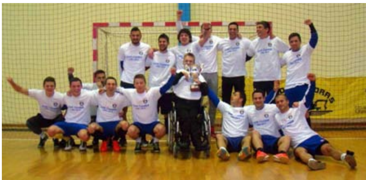
MNK Vid na dodjeli pehara i medalja za osvojeno 1.mjesto UMA Metković