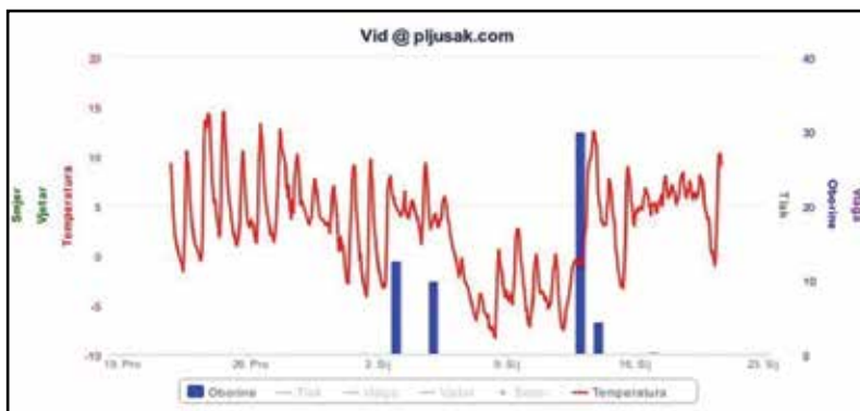
Grafikon prikaza temperature i oborina u Vidu za siječanj 2017.