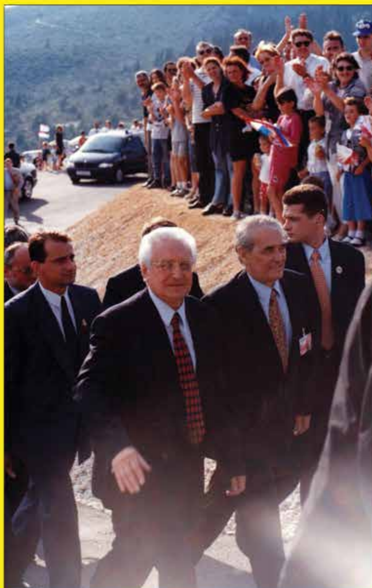
Predsjednik RH dr Franjo Tuđman i ministar obrane Gojko Sušak na otvaranju spomenika knezu Domagoju u Vidu 13.lipnja 1997.g.