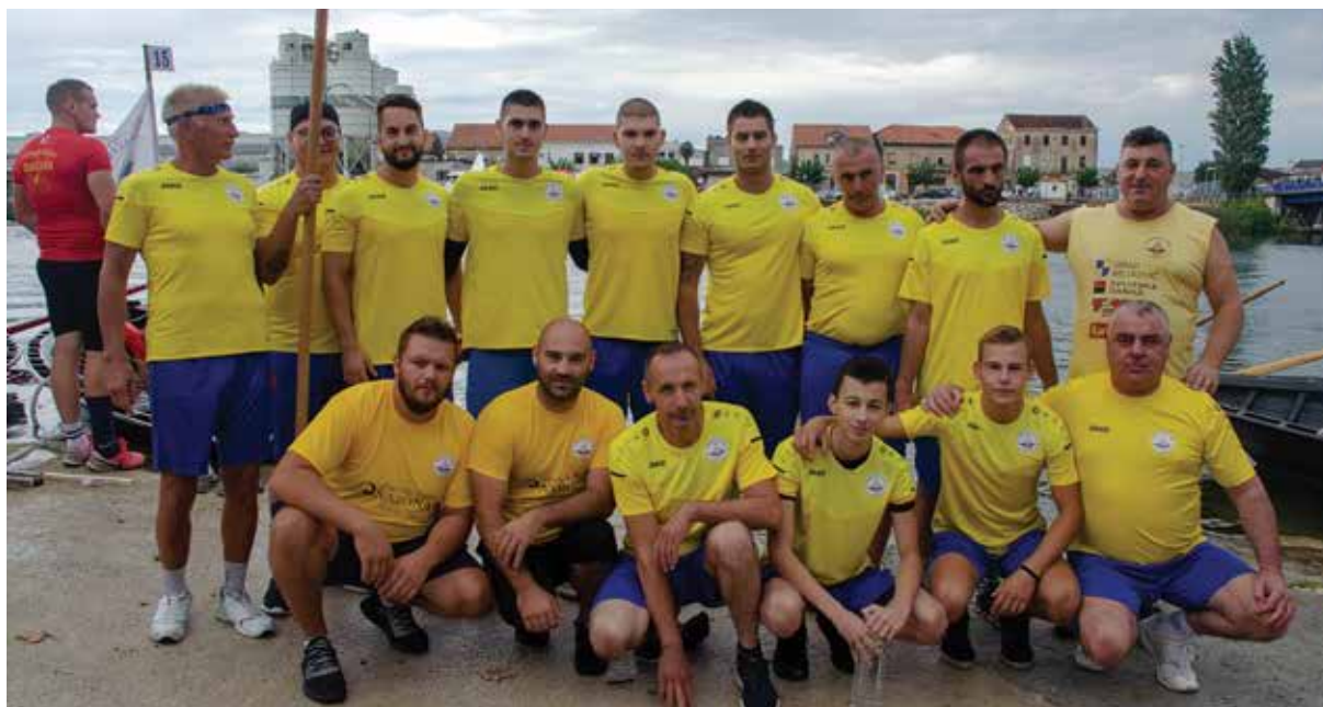
Domagojevi gusari na 25. maratonu lađa