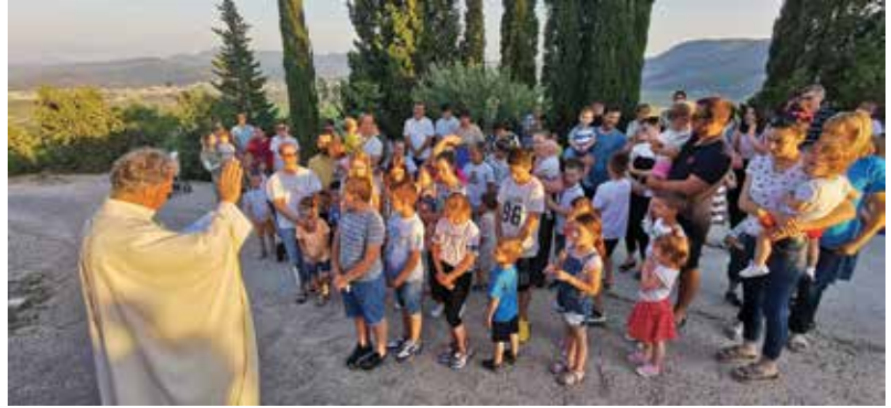
Blagoslov djece na blagdan Sv. Ante na ograđu 13. lipnja

Svetom misom u 19 sati kod zavjetne kapelice sv. Ante na Ograđu, sagrađene 1934. godine, proslavljen je blagdan ovog sveca kojeg se mnogo štuje u hrvatskom narodu. U našoj bližoj okolici, štuje se u Novim Selima, Kominu, na Dubravici kod Metkovića a najveće svetište je na Humcu kod Ljubuškog gdje se nalazi istoimeni franjevački samostan kojem hodočaste brojni naši župljani. Na kraju