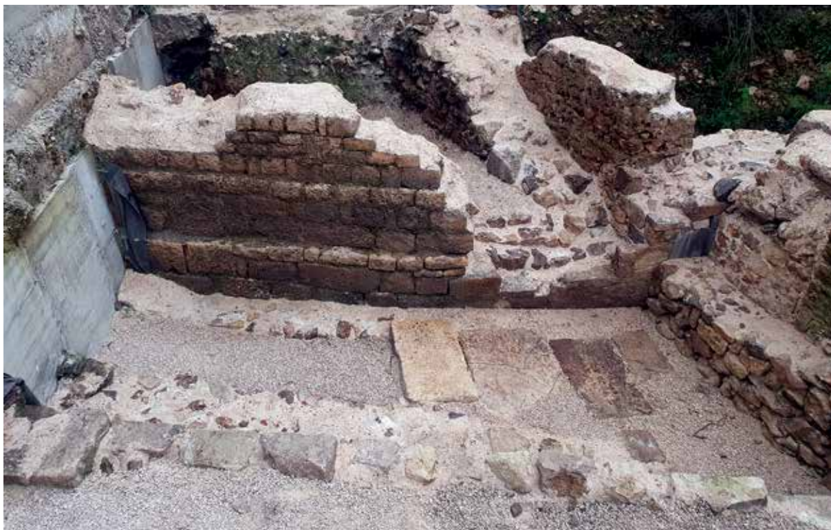
Privremeno konzervirana višeslojna rimska arhitektura u ulici Tade Suton

muzeja za posjetitelje, odlukama Vlade RH u 2006. godini, u Vidu je osnovana nova muzejska ustanova – Arheološki muzej Naroni. Mlada ustanova treba je najprije steći publiku i nametnuti se kao nezaobilazno odredište posjetitelja zainteresiranih za antičko nasljeđe. Svi naponi na početku rada bili su usmjereni ka tom cilju. U godinama koje su uslijedile nakon otvorenja muzej je stekao svoju stalnu publiku. Organizirani muzejski programi pažljivo su birani kako bi se zadovoljile potrebe posjetitelja svih dobnih skupina. Antičko nasljeđe Vida promoviralo se kroz raznovrsna događanja a najveća pozornost se pridavala mlađoj publici. Arheološki muzej Naroni sudionik je svih nacionalnih muzejskih akcija koje se provode u Republici Hrvatskoj. Osim toga, inicijator je i samostalnih događanja u kojima se osobita pozornost