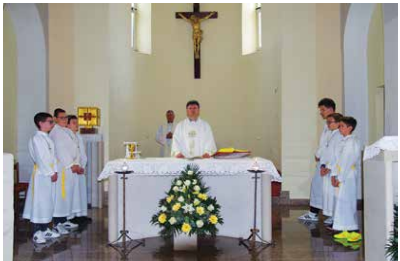
Sveta misa na Uskrs