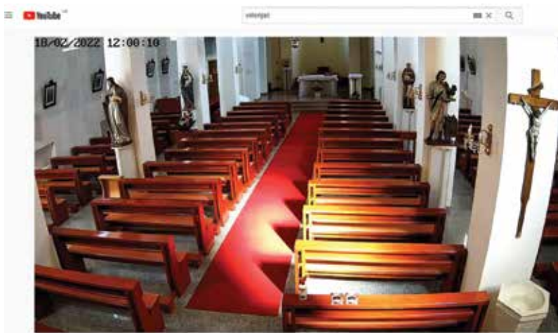
Prijenos svete mise iz Vida na YouTube