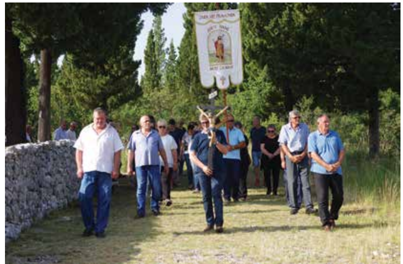
Procesija na blagdan Sv. Ivana na Dragoviji

Svetkovina svetog Ivana u župi je proslavljena dan ranije odnosno 23. lipnja umjesto 24. lipnja. To je zbog toga jer je na taj dan blagdan Presvetog Srca Isusova koji se redovito slavi treći petak nakon Duhova. Takvo se podudaranje ovih dviju svetkovina dogodilo zadnji put 1960. godine, a ponovit će se u našem stoljeću još 2033. i 2044. godine. Liturgijsko pravilo navedeno u Misalu i Časoslovu kaže da ako se na isti dan podudara više slavlja, "viši stupanj ima uvijek prednost, a niži se izostavlja". Sva tri stupnja liturgijskih slavlja gradacijski su podijeljena na ukupno 13 brojeva, od kojih se prva četiri broja odnose na svetkovine. Njima se izriče stupanj važnosti, odnosno prednosti neke svetkovine. Tako su najvažnije svetkovine Vazmenog trodnevlja muke i uskrsnuća Gospodnjega, označene brojem 1