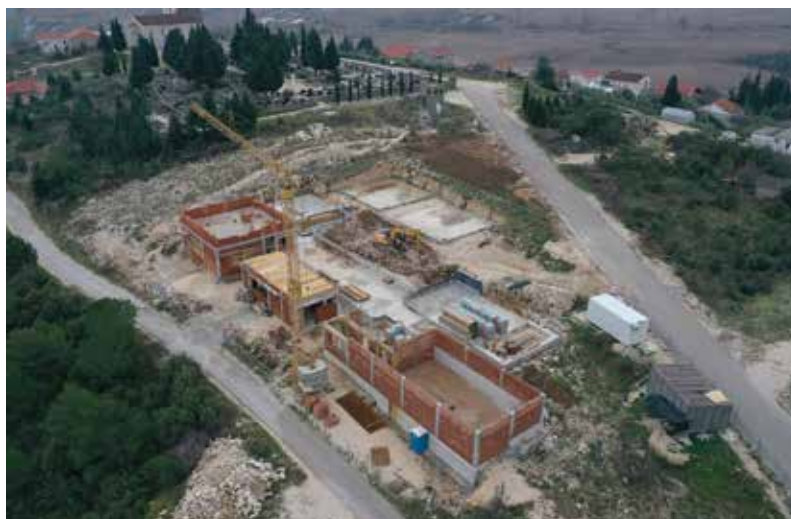
Zračni snimak gradilišta nove muzejske zgrade

Sve gore navedeno pokazuje kako glavna muzejska zgrada ne zadovoljava prostorne potrebe za raznovrsne programe u organizaciji muzeja. U projektu je zgrada bila zamišljena kao muzejski paviljon a ne sjedište muzejske ustanove te joj nedostaju prostori za brojne muzejske sadržaje. Stoga se prostorije stare zbirke u školskoj zgradi u Vidu i dalje koriste kao muzejski radni i