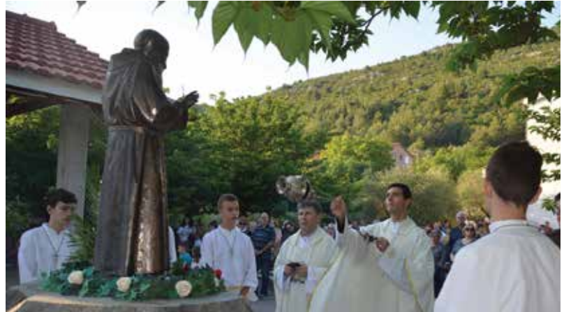
Blagdan svetog Leopolda Mandića u Prudu 12. svibnja