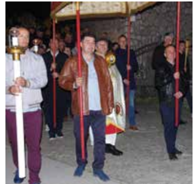
Procesija na Veliki petak

obavljen je blagoslov uskrasnih jela. Vrijeme je bilo suho s burom dok je temperatura bila ugodnih 16°C. Svetim misama u Prudu u 8.30 i Vidu u 10 sati