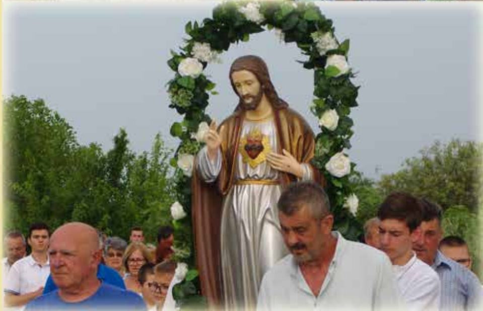
blagdani sv. Leopolda, sv. Vida, sv. Ivana, Presvetog Srca Isusova Gospe od Snijega