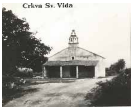
Crkva Sv. Vida

Vidonjska je toponimija najboljim pokazateljem kako česte i nagle smjene stanovništva prekrivaju tragove starijih jezičnih stanja. Trag je bogate antičke baštine u vidonjskoj toponimiji tek ime rječice Norilj u kojoj se odrazilo ime antičkoga središta Narone . Iz mjesne je toponimije razvidno i kako se u Vidu moralo nalaziti barem manje trgovište solju te se naziru neka izumrla prezimena.