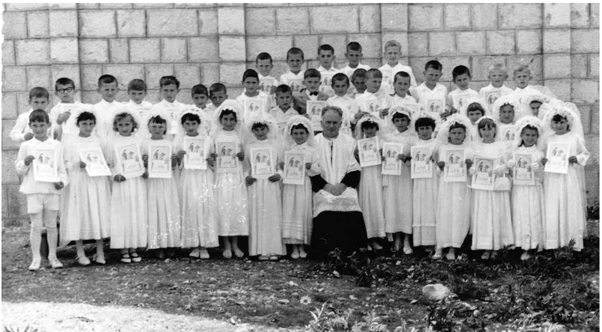
Zajednička slika svih prvopričesnika / prvopričesnica iz 1966. godine