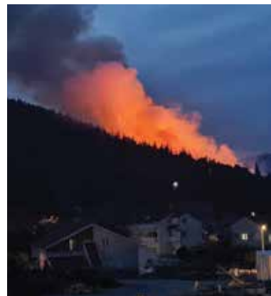
Požar iz blata zahvatio je gustu borovu šumu tzv. "Gaj"

Ispod zadnjih kuća na Pristupku vatra je također prešla Norilj i zahvatila dio šume poviše ceste koji su vatrogasci uspjeli ugasiti. No malo dalje gdje je gušća, mlada šuma nisu uspjeli, pa je vatra nastavila gorjeti uzbrdo prema vrhu Gaja te prešla protupožarni put koji kroz šumu ide iz Pruda u Vid. Vatra je negdje oko 21 sat stavljena pod kontrolu. Gorjelo je i blato do ceste u Ivanovoj dragi kod tzv. Babine škrinje (rimski znak uklesan u stijeni), a zbog požara je jedno vrijeme bio zatvoren promet između Vida i Metkovića te