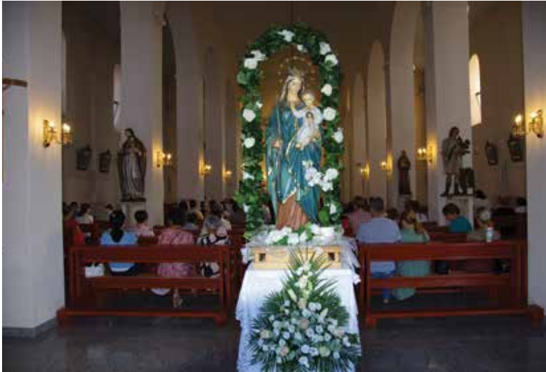
Blagdan Gospe Snježne u Vidu 5.8.2022., sveta misa u 9:30 h