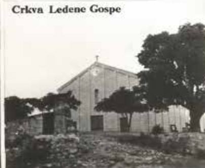
Crkva Ledene Gospe