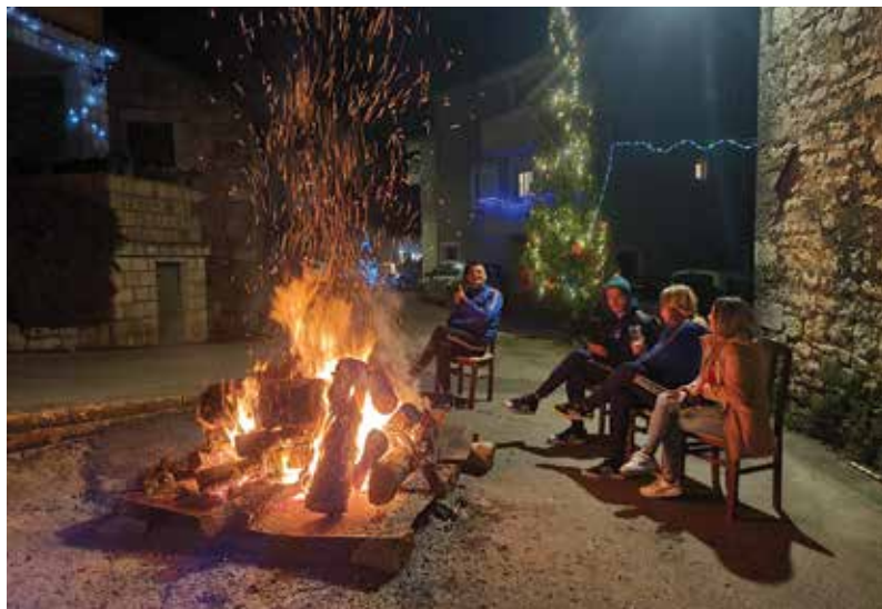
Badnjak kod "Pivca"

U župnoj crkvi Gospe Snježne u Vidu, tradicionalnom svetom misom ponoćkom na Badnju večer proslavljen je Božić, rođenje Isusovo. Nakon dvije godine u pandemiji koronavirusa te zaštitnih maski, ove godine ponoćka je održana kao i nekada, točno u ponoć. Vrijeme je bilo suho bez padalina a temperatura je iznosila 7,5°C. Nakon završetka ponoćke iz Zetovske ulice priređen je vatromet. I ove godine diljem župe tradicionalno su se palili badnjaci.