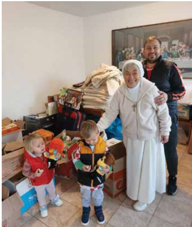
Sve skupljeno donirao je domu za nezbrinutu djecu "Ivana Pavla" u Međugorju

Od 27. studenog do 4. prosinca trajala je humanitarna akcija u Vidu i Prudu u kojoj se prikupljala hrana, higijenske potrepštine i slatkiši. Sve što je skupljeno donirano je Domu za nezbrinutu djecu Ivana Pavla u Međugorju.