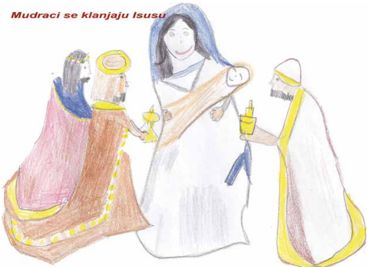
Iva Volarević, 2 razred-Prud