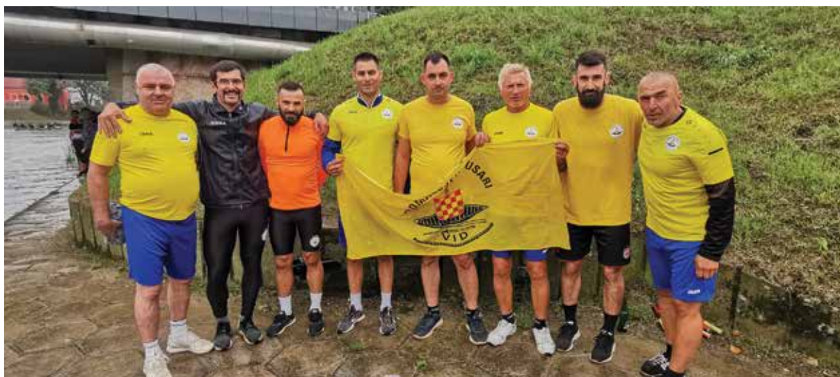
Domagojevi gusari prvi na maratonu lađa u Vinkovcima

I ove godine HŠSKD Narona napravila je božićni ugodaj na Naronskom trgu u središtu mjesta. Postavljene su jaslice i okićen bor te su postavljene skulpture sobova i snjegovića.