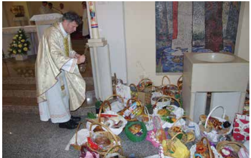
Blagoslov jela na Veliku subotu

ujutro proslavljen je najveći katolički blagdan Uskrs. Po prvi put u višedesetljetnoj povijesti mjesta i župe, misa je bila bez procesije koja je ranije ukinuta.