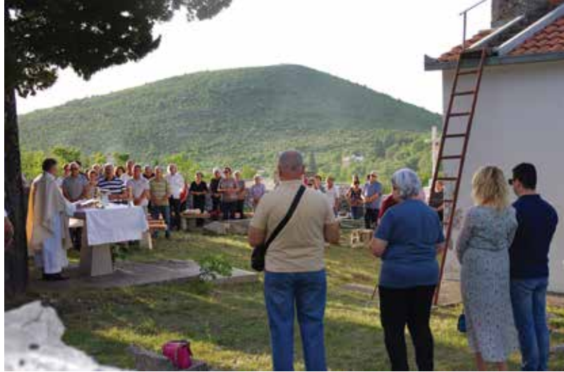
Vukovdan na Dragoviji