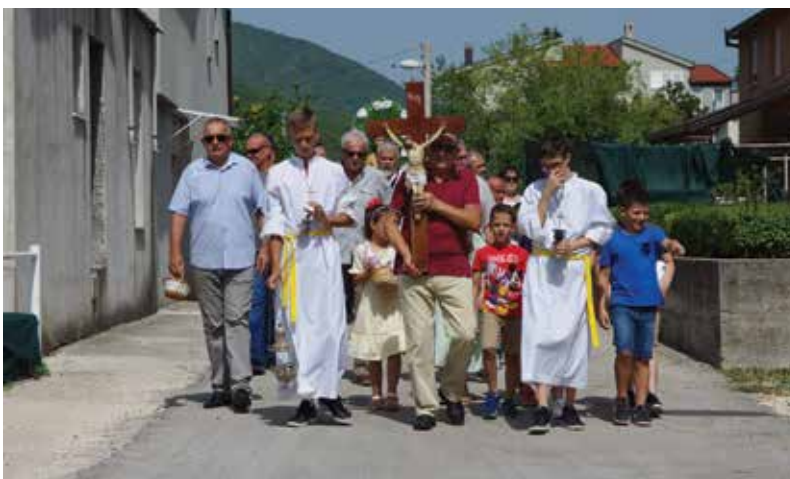
Procesija na blagdan Sv. Ivana u Prudu