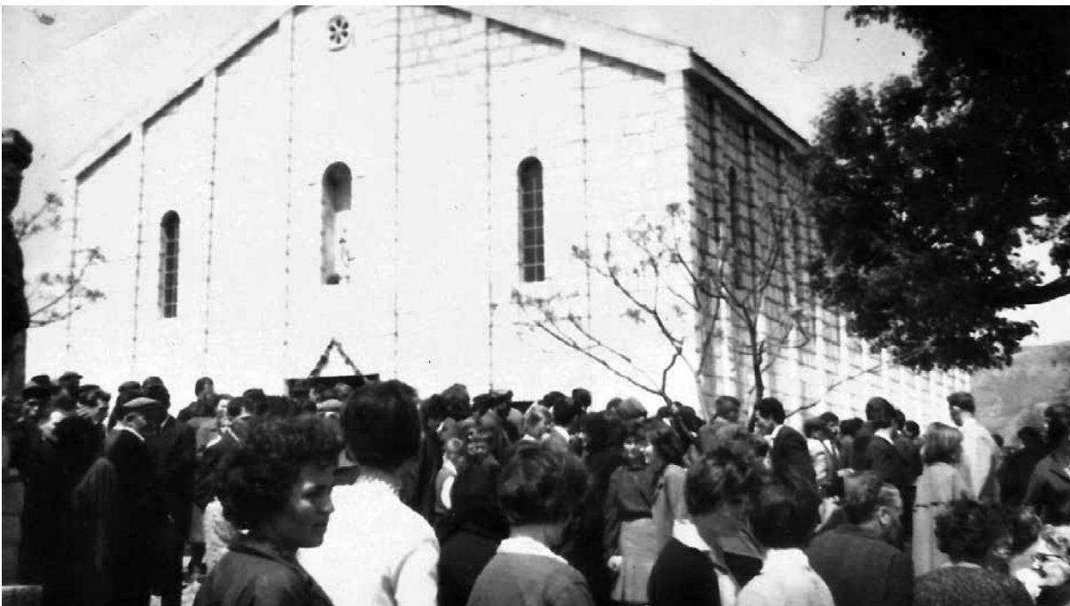
Blagdan Ledene Gospe, fotografija snimljena prije 1972