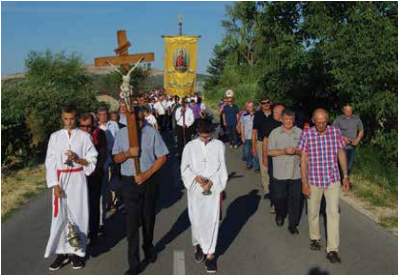
Blagdan svetog Vida

u ovom izazovnom vremenu. Od vas očekujemo molitvu, lijepu riječ, koristan savjet i da budete primjer poput Eleazara. To nije uvijek lako. Nije lako kada je život težak, kada je križ velik i kada su izazovi života ogromni... Svatko ima svoj križ. Zato je važno danas, kada gledamo primjer sv. Vida, naučiti od njega kako nositi svoj