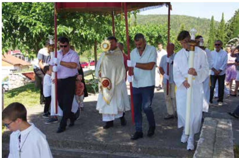
Tjelovska procesija u Vidu

je u spomen na ustanovljenje Euharistije na Veliki četvrtak. Svetkovina Tijela i Krvi Kristove jedna je od blagdana koji su duboko ukorijenjeni u život Katoličke Crkve.