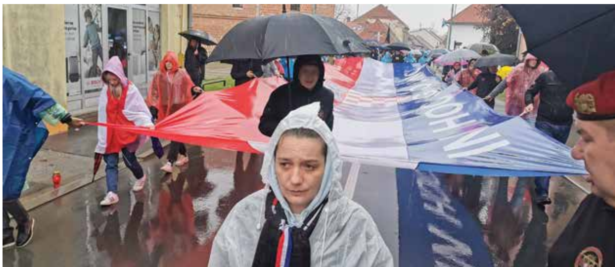
Kolona sjećanja u Vukovaru 18. studenog 2022.